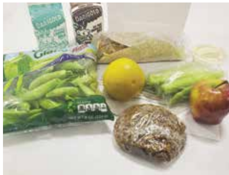
Meals Available to All Youth in Lincoln County

En respuesta a la congelación de 2 semanas relacionada con COVID en todo el estado, el servicio de comidas en el autobús del distrito escolar del condado de Lincoln continuará hasta nuevo aviso. Los estudiantes que participen en actividades en los edificios continuarán recibiendo esas comidas en el edificio. El servicio en la acera/ calle de las escuelas continuará hasta las vacaciones de invierno hasta el 18 de diciembre. Las cajas de comida que contienen siete días de comida para las vacaciones de invierno estarán disponibles para recoger en ubicaciones junto a la acera el 18 de diciembre.