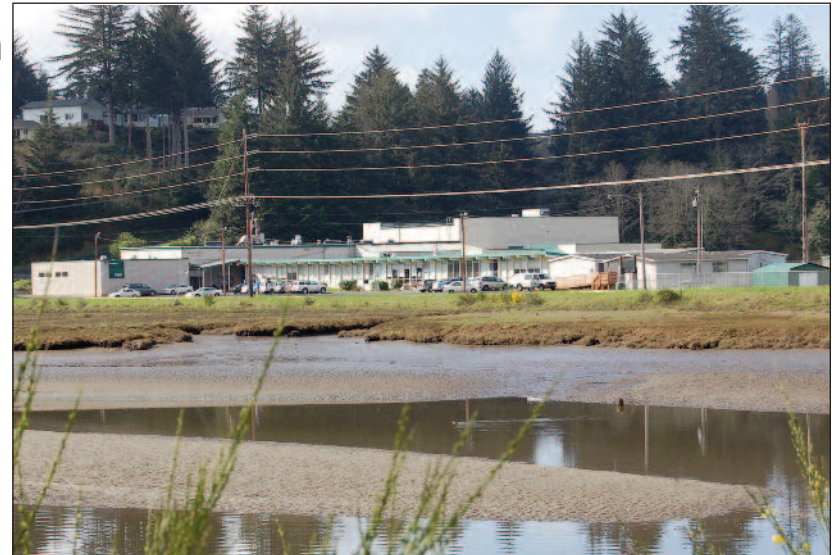
MAREA BAJA EN LA CIÉNAGA DE PELUSA. Esta perspectiva de ver al suroeste muestra que el bachillerato de Waldport se encuentra a pocos pies por encima de la ciénaga de pelusa, que es alimentado por la Bahía de Alsea. El Departamento de Geología e Industrias Minerales de Oregon hizo una evaluación sísmica de la escuela y la calificó de tener un "colapso de alto potencial." Si es aprobado por los votantes, el bono financiaría la reubicación de la Escuela preparatoria de Waldport a terrenos altos adyacentes a la escuela Crestview Heights, consolidando las instalaciones educacionales del área sur a un solo lugar.

• La actualización o renovación de la calefacción / ventilación, plomería y sistemas eléctricos para mejo-